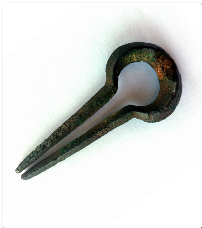
Idiazabalen topatutako tronpa. SNN

Argazkian ikus daitekeen bezala, tronpak mihia falta du, soinu-tresnako atal ahulena, eta Gipuzkoa eta Nafarroako zenbait gaztelutako indusketetan azaldu diren tronpa batzuen antzekoa da.