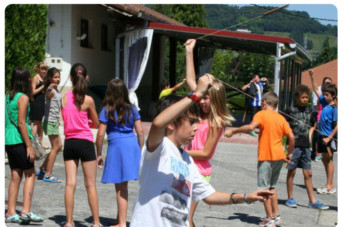
Oiartzungo gazteak egin berria zuten burruna probatzen.

Dena den, bisitari kopurua igotzearen arrazoi nagusia Oarsoaldeko udalekueetan zeuden haur eta gazteak Oiartzungo inguru honetara etortzean dago. Adin ezberdinetara egokitutako ekintzak antolatuta, goiza jolastuz ikasten pasatzeko aukera izan zuten Oiartzun eta Pasaiatik etorri ziren neska mutikoek. Batzuk erakusketan jarriak dauden soinu-tresnak entzunez jolasten aritu ziren, beste batzuk dantzan, eta denbora gehien pasatzeko aukera izan zutenek ondoren etxera eraman zituzten soinu-tresnak egin zituzten.