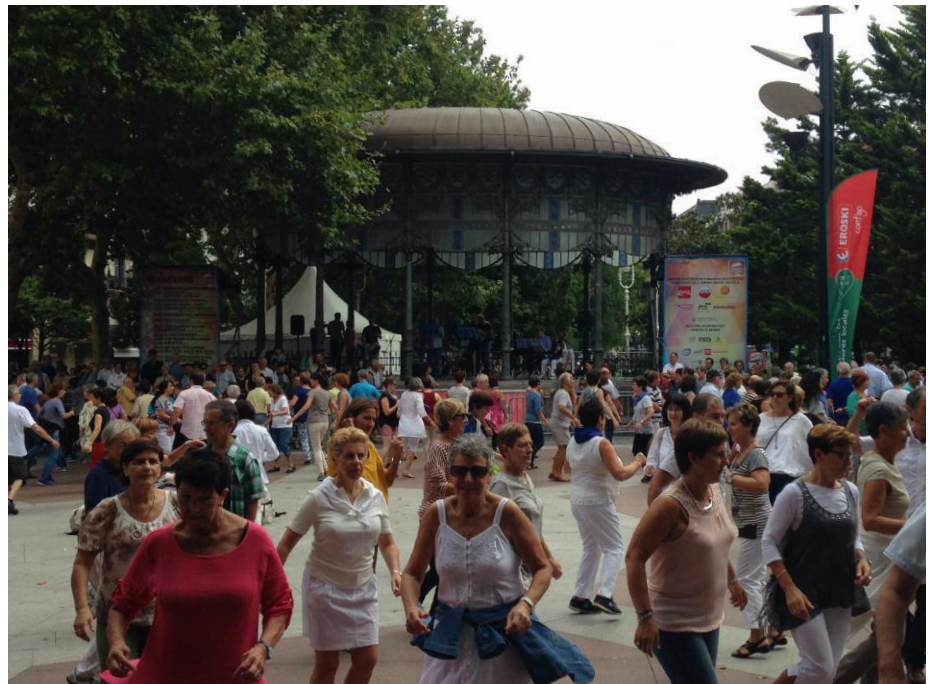
Donostiako Boulevardeko musika kioskoaren ondoan dantzan. SNN

Aipagarria iruditzen zaigun aldaketa horietako bat, eredu koreografikoan antzeman dezakegu. Hasieran