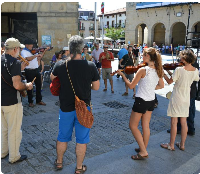
Biolin jotzaileak xirula, xiro-larru eta pandero jotzaileek lagunduta Oiartzungo kaleetan Xanistebanetan egin zuten kalejiran.