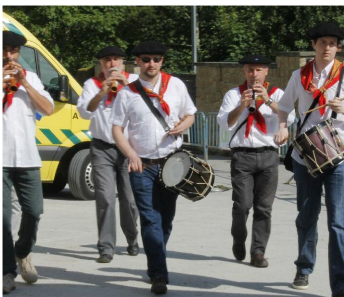
Dultzaina taldea Ergoingo festetan kaleak alaitzen. SNN

Hurrengo ekintzak Oiartzungo Xanisteban festetan izango dira. Batetik, adin ezberdinetara egokitutako erromeriak izango dira: abuztuaren 3 eta 5ean 19:30etan Dantza-bilera eta abuztuaren 4an 17:30etan Erromeria Familiar. Dantzaldi hauek Done Eztebe enparantzan izango dira. Bestetik, festetan talde ezberdinen kalejirak eta dultzaineroen urteroko topaketa izango dira: abuztuaren 4an eguerdiko 12:00tan Oiartzungo eta Hernaniko albokariaren kalejira eta arratsaldeko 18:00tan Donostialdeko eta Oarsoaldeko Dultzaineroen topaketa, abuztuaren 5ean 12:00tan Oiartzungo HM Eskolako biolin jotzaileen kalejira eta abuztuaren 6an 12:00tan Oiartzungo HM Eskolako xiolarru eta dultzaina taldeen kalejira.