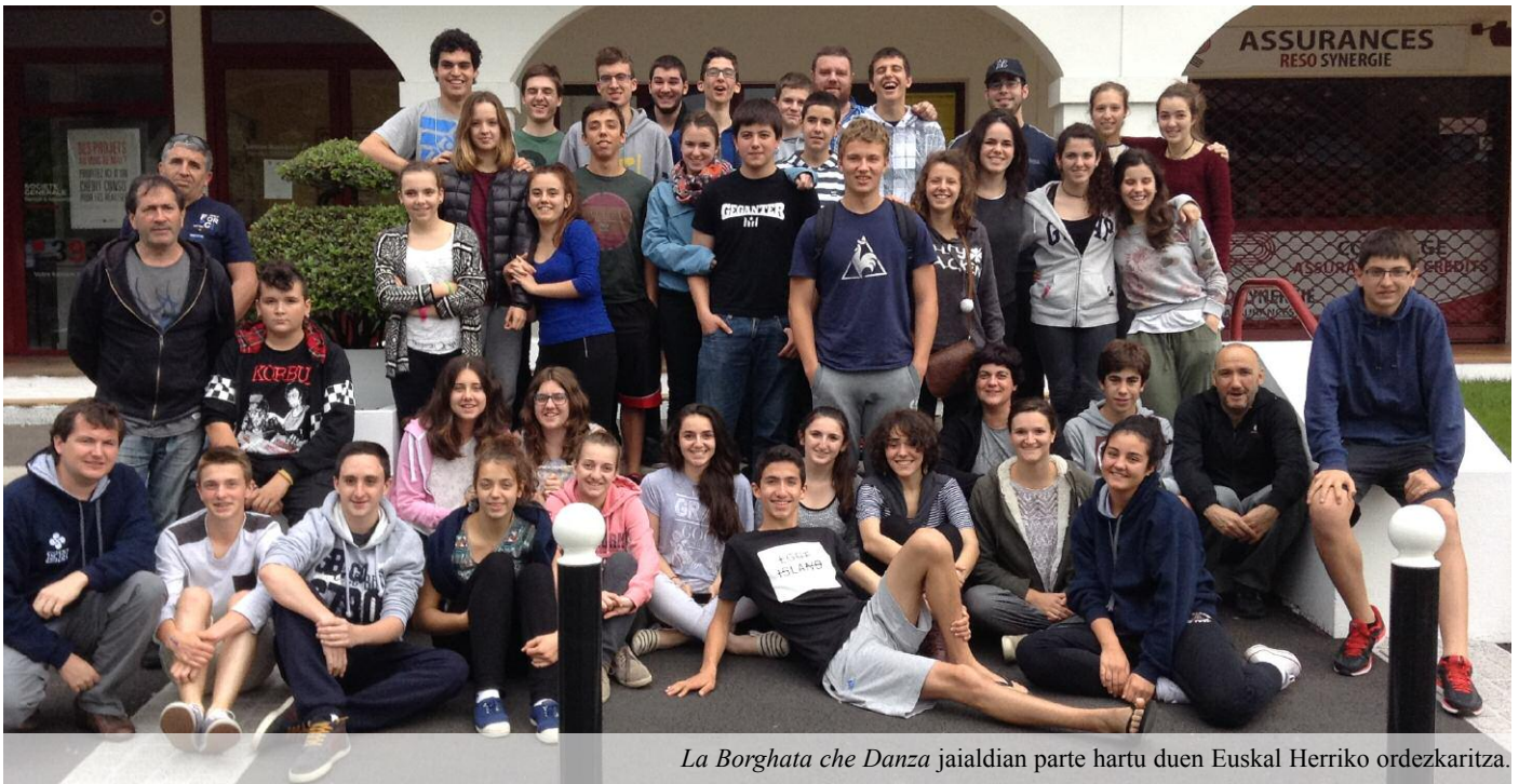
La Borghata che Danza jaialdian parte hartu duen Euskal Herriko ordezkaritza.

Joan den maiatzaren 21 eta 25 artean, Oiartzungo HM Eskolako ikasleak, "Hernani" musika eskolako fanfarrak, txistulariak eta albokariak, eta Leinua taldeko dantzariak Italiako Bellaria-Igea Marina herrian izan ziren (Romagna eskualdea) 23. La Borghata che Danza jaialdian parte hartzen.