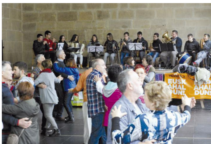
Dantzaldia Oiartzungo Kontsejupean Hernaniko fanfarearekin. SNN

Igandean alde praktikoa goizean izango den dantza tailer batekin eta eguerdiko plazako dantzaldiarekin osatuko da..