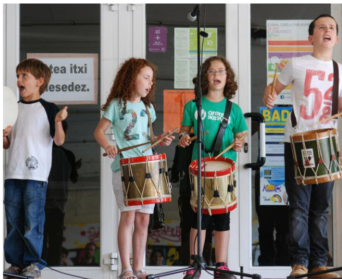
Pandero eta danborrak jotzeraekin batera kantatzen. SNN

Ikasturte bat bukatu da eta bestea bidean da. Oiartzungo HM Eskolan alboka, biolina, dultzaina, perkusioa, txalaparta edo xiolarrua jotzen ikasteko aukera dago eta matrikulatzeko epea ekainaren 26an bukatu bada ere, interesa duenak Soinuenera deitu eta informazioa eskal dezake.