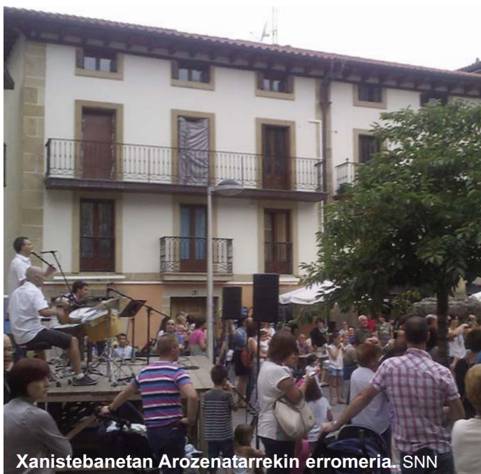
Xanistebanetan Arozenatarrekin erromeria. SNN

Urtean zehar antolatzen ditugun ekitaldien artean aipamen berezia merezi dute kontzertuek. Sasoi bakoitzerako kontzertu bat antolatuz jarraitu dugu. Hauen iraupenak eta helduen beharrik haurren etatik ezberdinak direla kontuan hartuz goizetan txikienei eta bere ingurukoei begira iaz martxan jarri zen kontzertu didaktikoekin jarraitu dugu eta izaten duten jarraipenarekin oso pozik gaudela esan behar dugu.