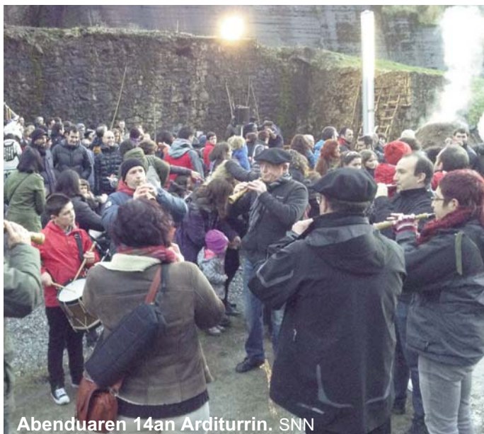
Abenduaren 14an Arditurrin. SNN