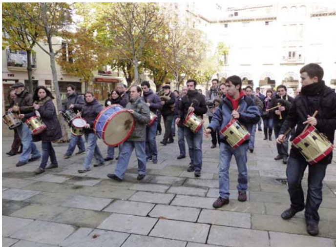
Oiartzungo eta Hernaniko Herri Musika Eskoletako ikasleak Logroñon Alberiteko, Lizarrako eta Debako eskoletakoekin. HMT

Erakusketan soinu-tresnak sei multzotan banatuta daude ikusgai. Gainera gela bat egokitu da nahi duenak bertan Euskal Herriko soinu-tresnak bideoa ikusteko aukera izan dezan. Horretaz gain, aretoaren erdian txalaparta bat eta toberak jarri dira gogoia duenak soinu-tresna probatuz ezagutzeko aukera izan dezan.