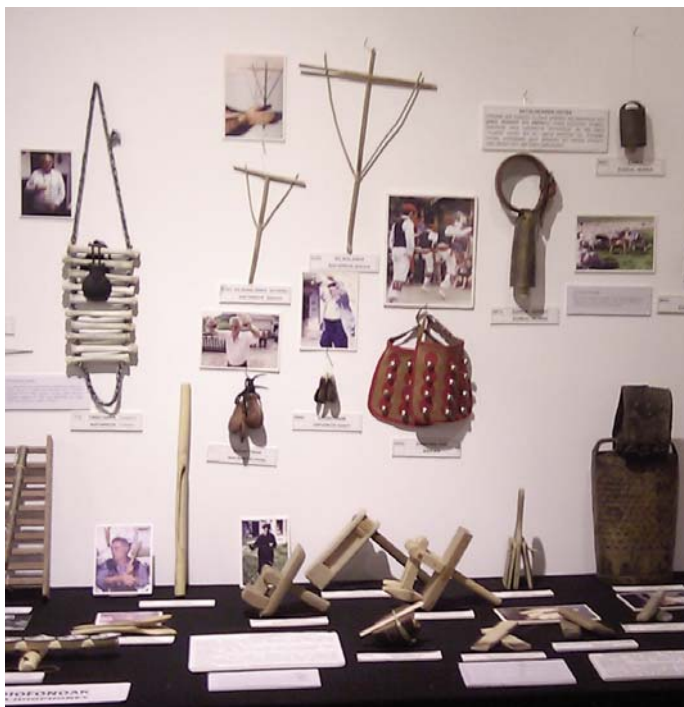
Erakusketa mugikorrek idiofonoetako batzuk . HMT