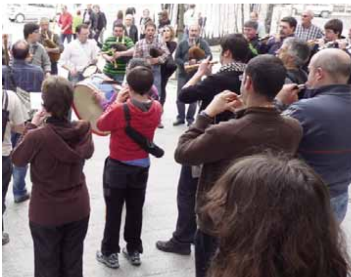
Gaita eta dultzainak jotzen Hernanin. HMT

Festa giro ederrean jarraitu genuen 14:30etan sagardotegi batera bazkaltzera joan arte. Bazkalondan sagardotegian jarraitu genuen gure joaldiekin eta goizean ibilitako kale horietan bigarren kalebuelta handi batekin bukatu genuen aurtengo topaketa. Ekainean Errioxan elkartuko gara.