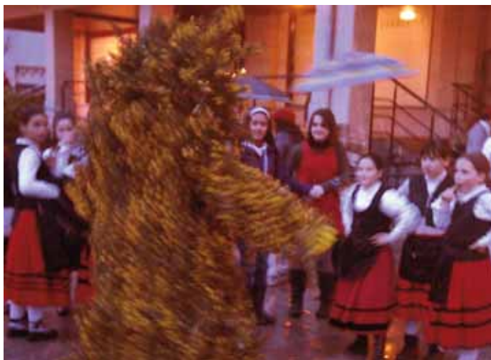
Otegizona dantzariak zirikatzen.