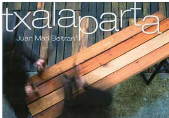
Liburuaren azala.