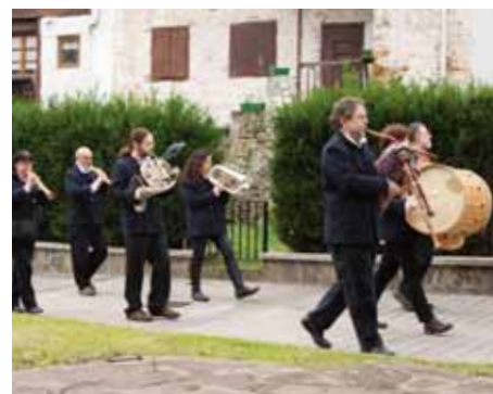
Els Minestrers de la Vila Nova Oiartzungo kaleetan. HMT

Plazako buelta osatutakoan guztiak elkartu eta Girizia elkartera bueltatu ziren bazkaldu eta jardunaldiei bukaera ematera.