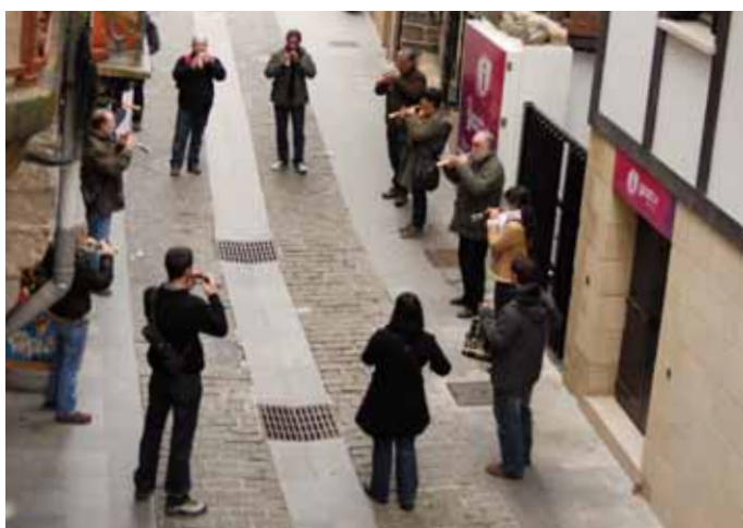
Oiartzungo HM Eskolako dultzaineroak. HMT

eta bertan txalaparta nola jotzen den ikusteaz gain hainbat txalapartari egindako elkarrizketekin liburu osatzen da.