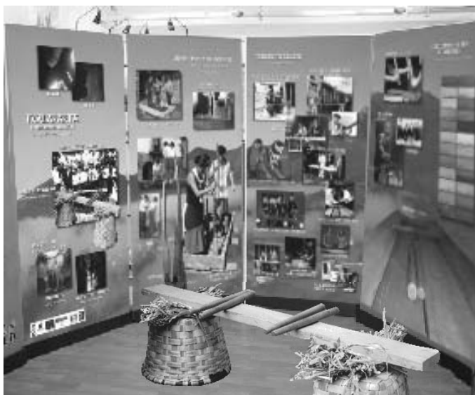
Erakusketaren zati bat.