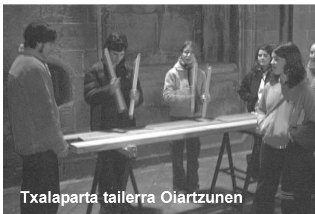
Txalaparta tailerra Oiartzunen

TXALAPARTA, EUSKAL HERRIKO BIHOZKADA izenburupean erakusketa hau adarra eta txalaparta eredu ezberdinez dago osatuta, baina 4 panel adie-razgarriak ere badaramatza, soinu tresna honi buruzko informazio ugarirekin. Informazio gehiago ere eskeintzen ditu erakusketan ipinita dagoen multimedia sistemak. Kartelak, argazkiak eta beste elementu ezberdinak ere aurki daitezke hemen.