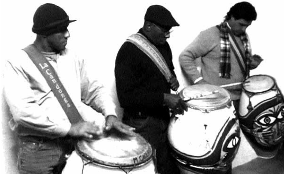
Candombé saio bat Montevideoko Haize Hegoan. HMT

Hurrengo hiria Arrecifes izan zen. Hango emanaldian bertako Grupo Maral taldearekin partekatu genuen oholta eta orduan sortutako harremanaren ondorioa da talde honek Oiartzunen emango duen kontzertua.