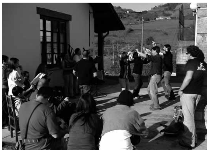
Xixongo "La quintana" Herri Musika Eskola 2008ko apirilaren 5ean Herri Musikaren Txokoa entseiatzen, Doneztebe plazan kontzertua eman aurretik. HMT

12:30'etan, Doneztebe enparantzan Kanpai eta ezkilak hotsak