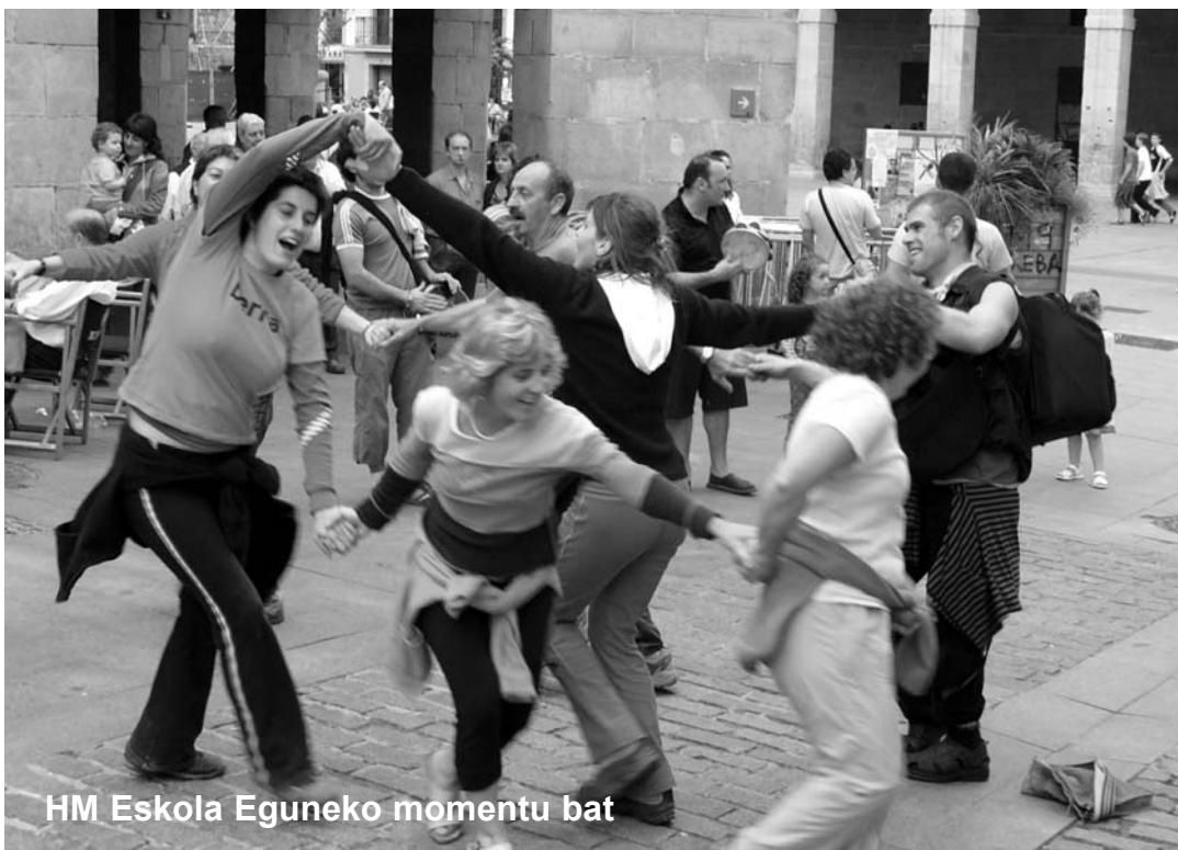
HM Eskola Eguneko momentu bat

2006ko otsaileko lauean Herri Musikaren Txokoa Galiziako " Conservatorio de Música Tradicional y Folque Lalín " eskolaren irakasle eta ikasleen bisita jaso genuen. Herri Musika Eskola hau eredugarria da Galiziako eta esparru zabalago batean herri musika hezkuntza eta zabalkuntzan.