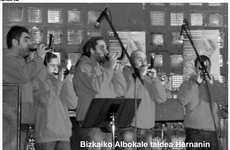
Bizkaiko Albokale taldea Hernanin