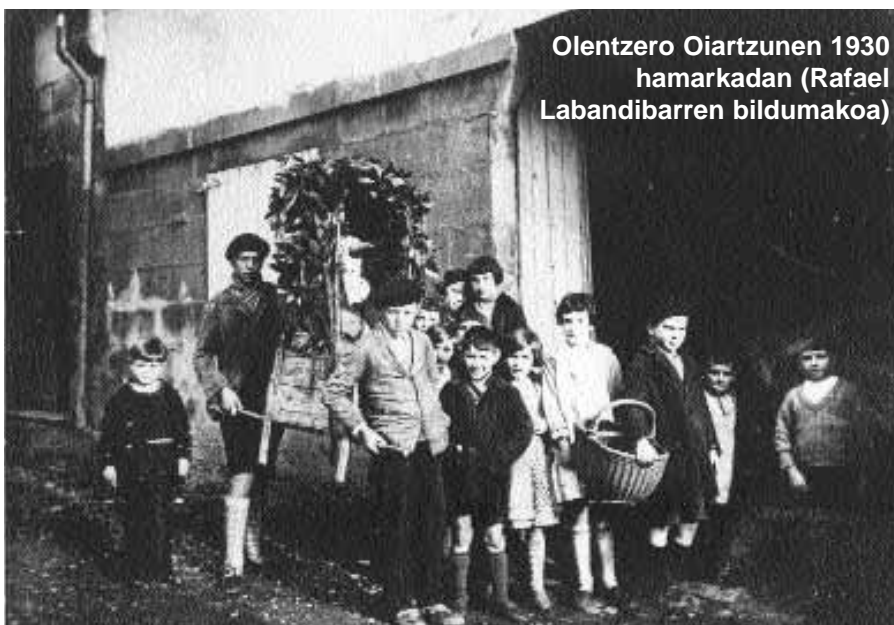
Olentzero Oiartzunen 1930 hamarkadan

Oiartzuarrok aspalditik ospatu izan dugu "Olentzero-eguna", leku askotan "Gabon-eguna" dena. Gure gazte-denboran, gerra-ondoren, eske eta kanta-eguna izaten zen eta ohiturak markaturik zeuden: goizpartean, mutil kozkor/neska kozkorak ibili ohi ziren eta gazte-jendea ilunabarrean; hortaz gain, beste ohitura jakingarria: gizonezkoak, txiki eta handi, olentzerorekin